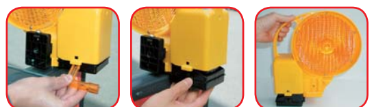
Brza i jednostavna izmjena baterija