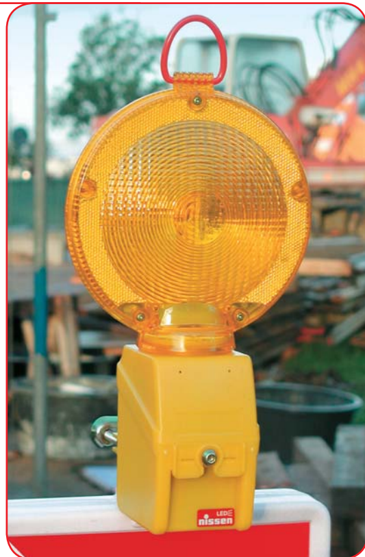
Sa robusnim sistemom za pričvršćenje i vijkom za brzu i laku zamjenu baterija.

20 svjetiljaka u kutiji - 400 svjetiljaka na paleti.