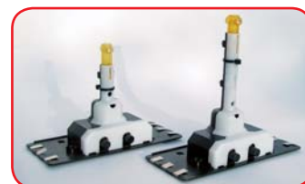
Treptački uređaj sa LE Diodama (nema potrebe za izmjenom žarulja)