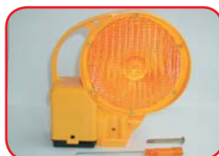
Sa ključem za otvaranje, uključivanje i montažu svjetiljke