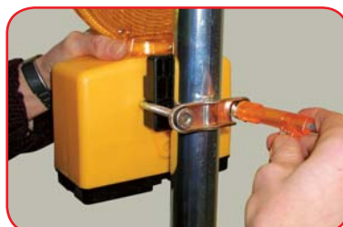
Zakopčajte objumicu i pritegnite maticu pomoću NiKo-ključa