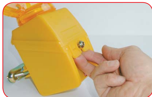
NiKo-ključ za montažu, otvaranje i uključivanje svjetiljke