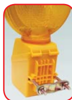
Sa montiranom šelnom