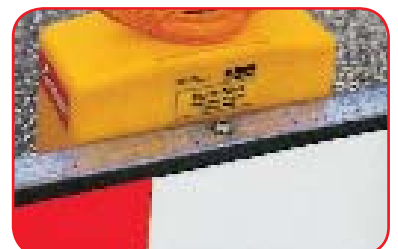
Pričvršćenje na vodoravnu zapreku