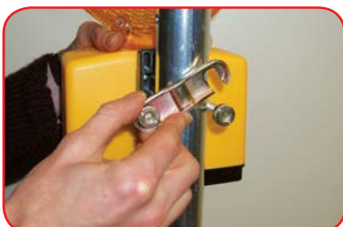
Postavite svjetiljku sa objumicom do cijevnog nosača