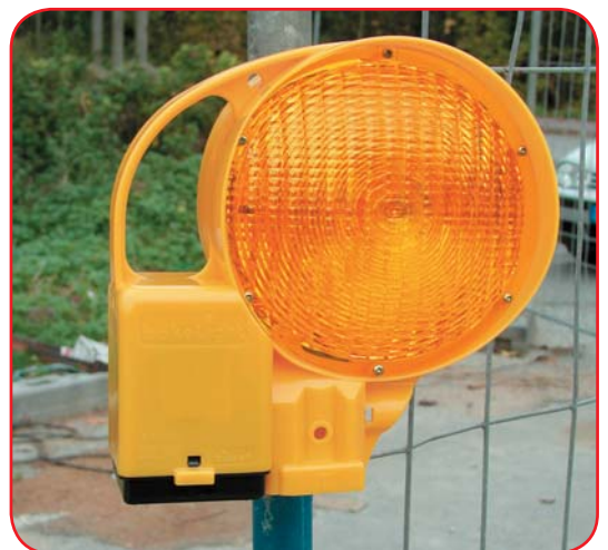
na metalnoj cijevi