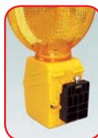
Nosač za montažu na vodoravnu zapreku