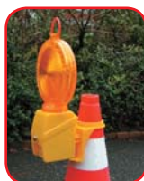
Sa nosačem za prometni čunj