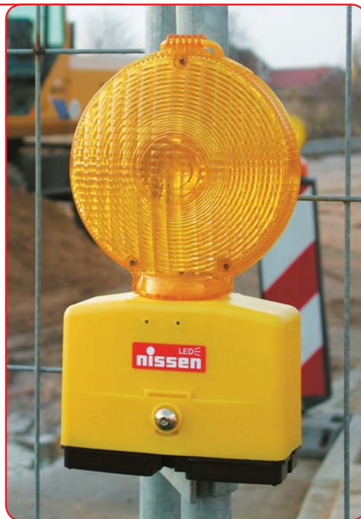
Brza montaža pomoću objumice