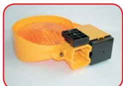
Natačna montaža (bez obujmice)